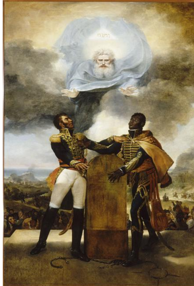
Guillaume GUILLON-LETHIERE, Le Serment des ancêtres (novembre 1802), Palais national d'Haïti, XIXe s.

Ce tableau représente la rencontre du chef des Mulâtres de Saint Domingue, Alexandre Pétion, et le général Jean-Jacques Dessalines serment dans la perspective de chasser les troupes françaises et donc à terme l'indépendance d'Haïti en 1804.