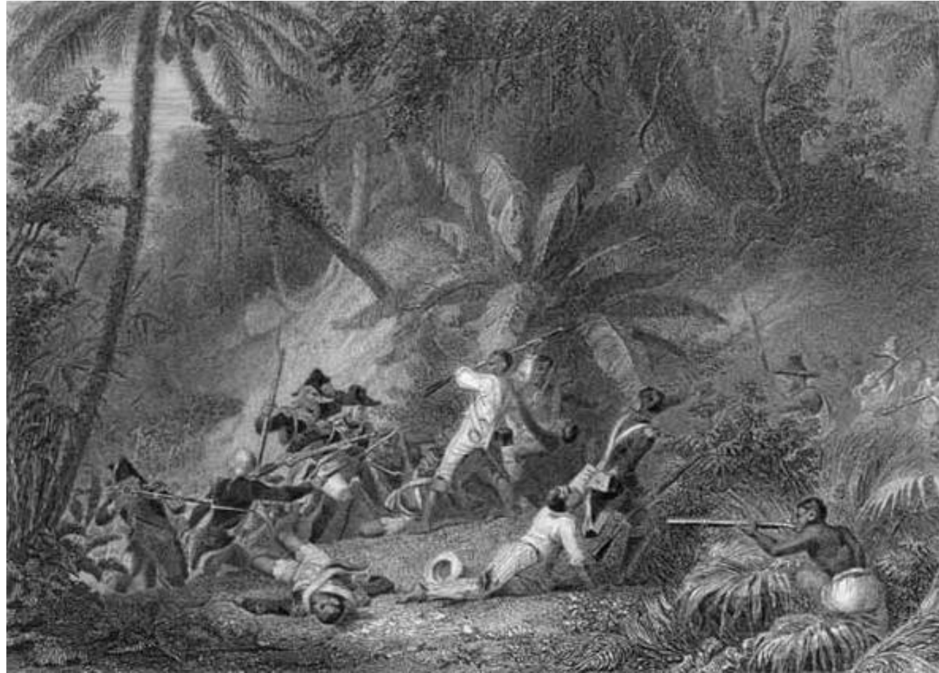
La bataille de Ravine-à-Couleuvres (23 février 1802) par Karl GIRARDET, gravé par Jean-Jacques OUTHWAITE publié dans l'ouvrage de Pierre LANFREY Histoire de Napoléon Ier, vol. 2, part. 1, Mc Gill University Napoleon Collection, XIXe s.

Le conflit avec les Anglais se terminant, Napoléon a informé Toussaint Louverture de l'envoi de troupes « pour faire respecter la souveraineté du peuple français ». Les troupes du général Leclerc débarquent sur l'île dès janvier 1802. La bataille de Ravine-à-Couleuvres est la première défaite de Toussaint Louverture qui sera arrêté le 7 juin.