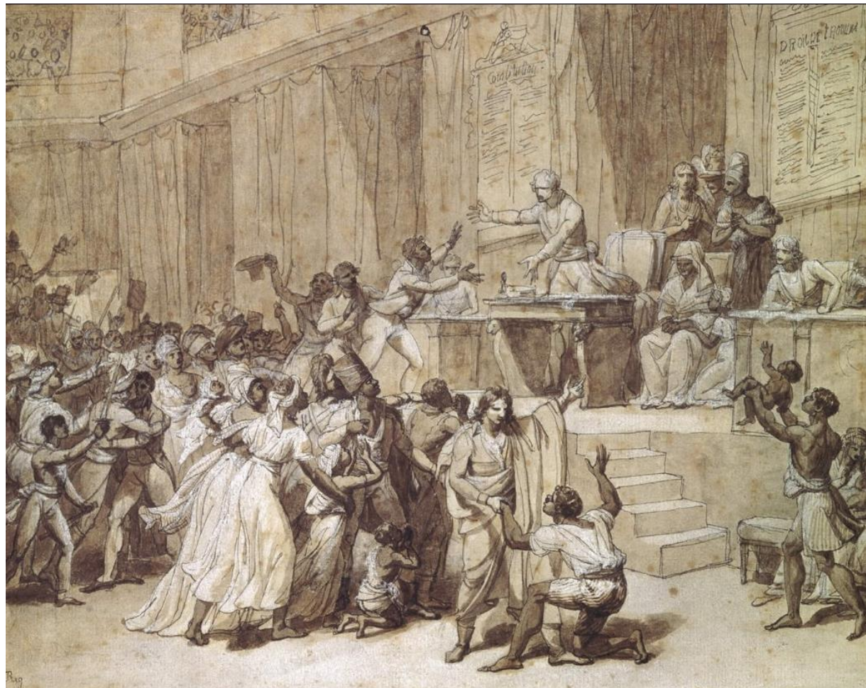
MONSIAU Nicolas André, L'abolition de l'esclavage par la Convention, le 16 pluviôse an II (4 février 1794), Musée Carnavalet ( 24x32 cm), 1794.

Face aux témoignages des trois députés de Saint-Domingue, l'esclave noir affranchi, le mulâtre et le colon blanc, envoyés par le commissaire, la Convention décide d'entériner l'abolition de l'esclavage proclamée par Sonthonax le 29 août 1793.