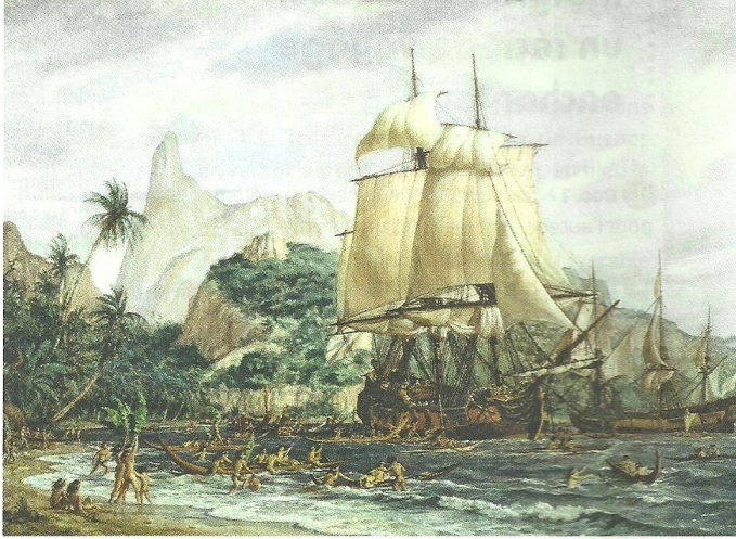
Gustave Alaux, Musée national de la Marine, Paris.