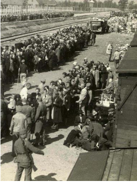
Génocide des Juifs d'Europe