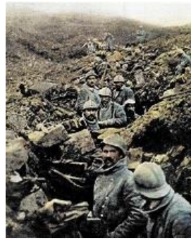
Première Guerre mondiale