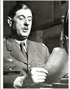
Le général de Gaulle lance son appel à la résistance depuis Londres