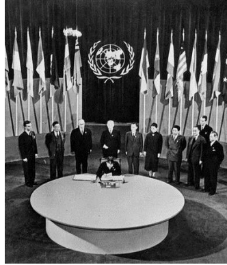
Création de l'ONU