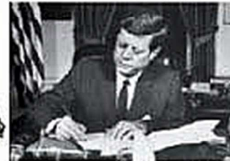
Le Président américain J.F. Kennedy signe l'ordre du blocus maritime de Cuba, le 24 octobre 1962 à la Maison Blanche

Les Américains lancent un blocus maritime de l'île. Kennedy demande à Krouchtchev de retirer missiles et navires